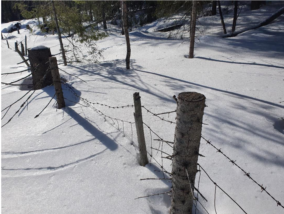
Bilde: Eksempel på dårlig vedlikeholdt utmarksgjerde med ulovlig piggråd som topptråd.