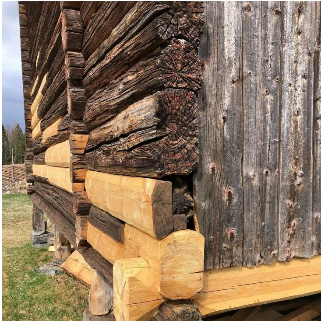
Foto: Vøiling av stabburet på Rud Klokkergård. Instagram: #rudklokkergard